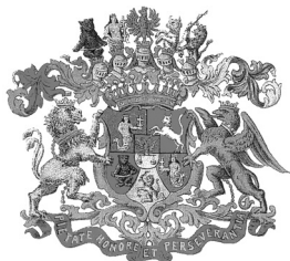
Stema familiei Karácsonyi

Ocolului Silvic, devine apoi Casă de bătrâni, orfelinat sau școală cu clasele I-X (1983-1991). O parte a parcului a fost atribuit fermei agricole. Consiliul Local Banloc a decis la sfârșitul anului 2007 concesiunea castelului pe o perioadă de 49 de ani în favoarea Mitropoliei Banatului, care își dorește să amenajeze în castel o tabără ecumenică și săli de conferințe.